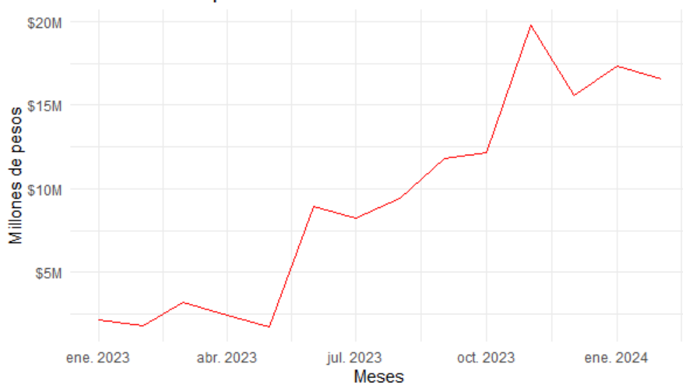
Var. del Precio promedio unitario de la venta de inmuebles en Salta